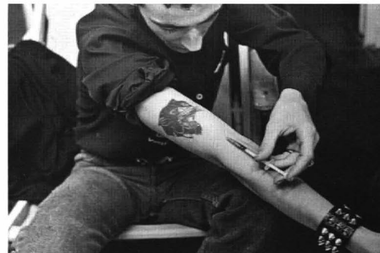
Alberto García-Alix., De donde no se vuelve - Willy chutándose - 1980

nes del imaginario colectivo, deberían asimilar los comportamientos y los estilos propuestos que configuran las identidades colectivas e individuales, a los que podemos asociar cuestiones como el sexo, las drogas, las modas, la música etc.