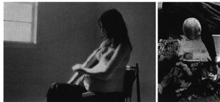
Larry Clak., Tulsa - Untitled - 1971