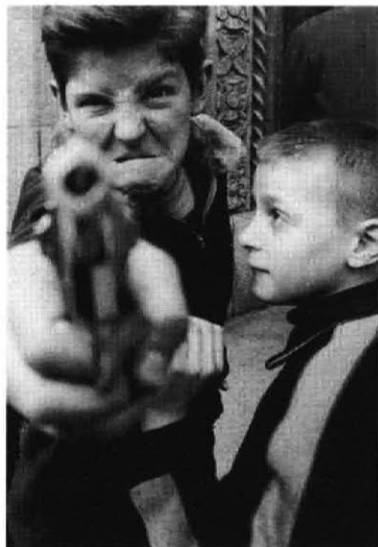
William Klein., New York 1954/1955 - Brodway and 103rd street, New York - 1955

Existe un primer grupo, es el que posee una ideología marginal manifestada por un carácter juvenil contracultural o subcultural, y que intenta reflejar en sus imágenes su visión del mundo. En este grupo podemos ver a fotógrafos como Robert Frank o William Klein.